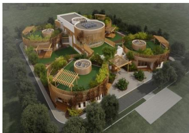
Экологичный детский сад BPS International