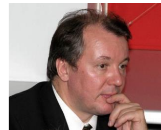
Тимо Мултанен, президент CEPI