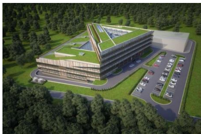
R&D Ренова ООО «Ренова Лаб»