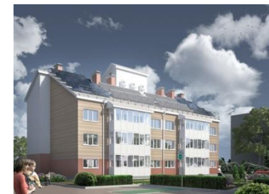
Жилой Дом «Надежда» Ассоциация GreenСтрой