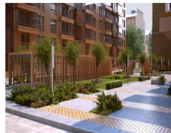
Шпалерная 51 Компания: ООО «Скавери»