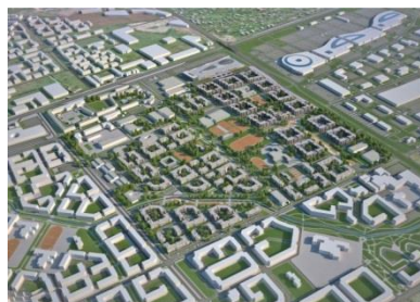
Город Цветов БКН-Девелопмент