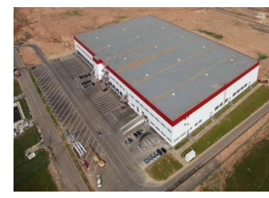
Индустриальный парк «Южные Врата» III фаза строительства, ПСК 4-Е Radius Group