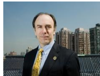
Роберт Уотсон, основатель LEED